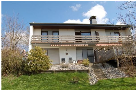
02 gesamtes Haus