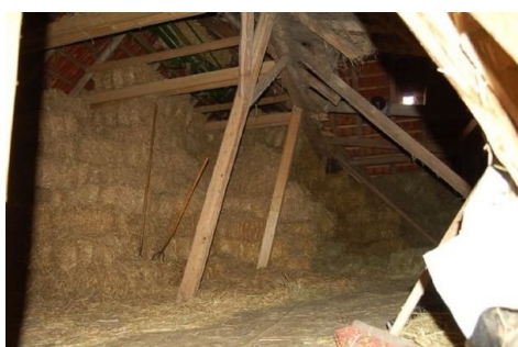
22 Dachboden als Heulager