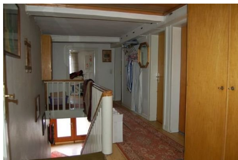
14 Flur OG