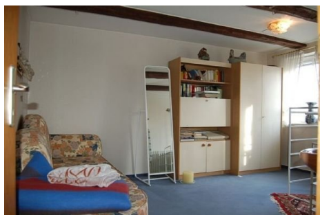
16 Zimmer OG