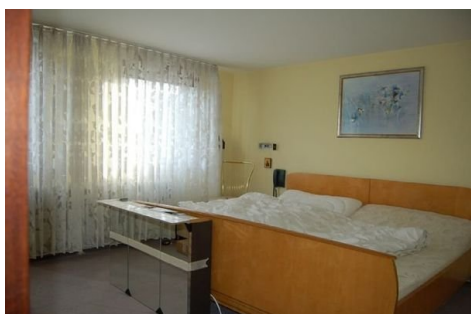
17 Zimmer OG