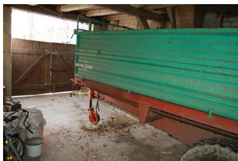
21 Tenne mit Platz für Mist-Anhänger