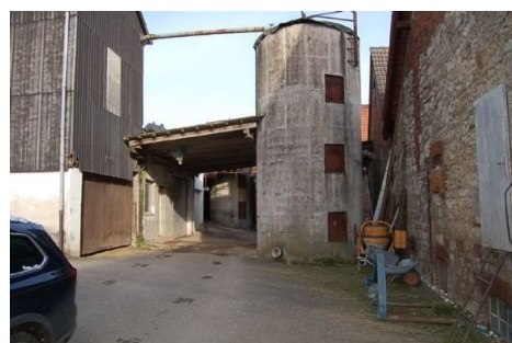
07 Hof mit Silogebäude