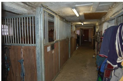
18 Stall mit Pferdeboxen