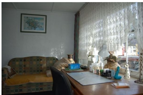
13a Zimmer EG