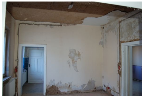
14 Zimmer Wohnung 1.JPG