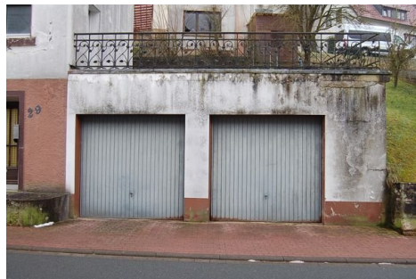
05 Garage vorne.JPG