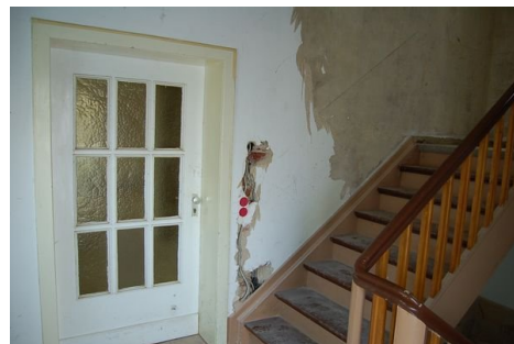
12 Eingang Wohnung 1.JPG