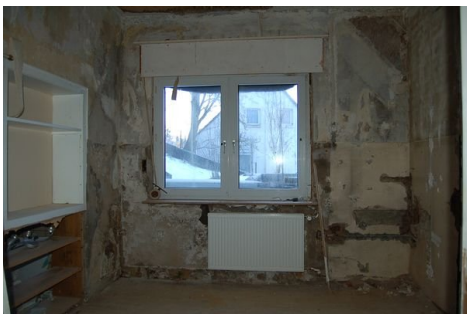
15 Zimmer Wohnung 1.JPG