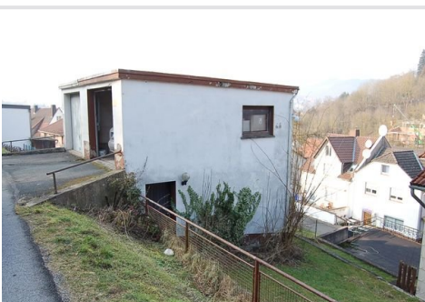
06 weitere Garage hinten.JPG