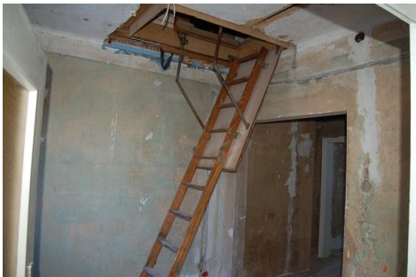
28 Zugang DG.JPG