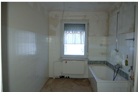
24 Bad Wohnung 2.JPG