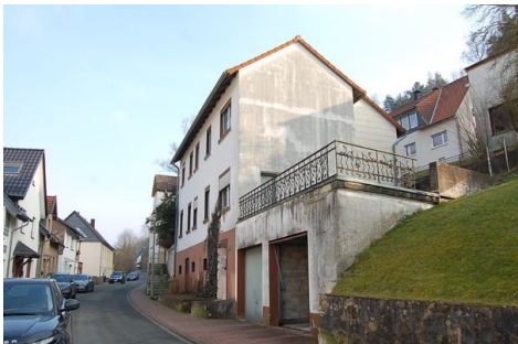
09 Gesamtansicht und Lage.JPG