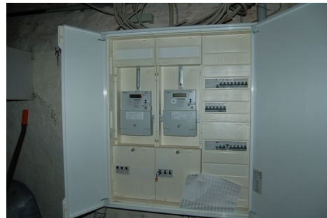
30 neue Elektroverteilung.JPG