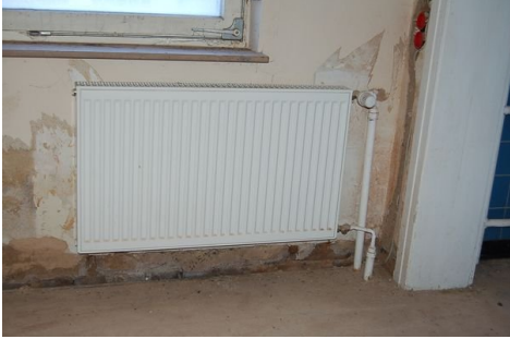
33 neue Heizkörper.JPG