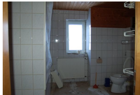
27 Zimmer DG.JPG