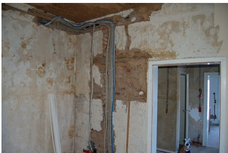
17 neue Elektrik Wohnung 1.JPG