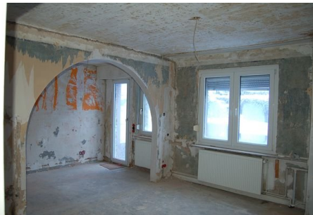
22 Zimmer Wohnung 2.JPG