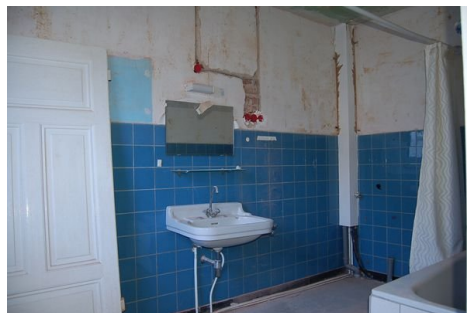
18 Bad Wohnung 1.JPG