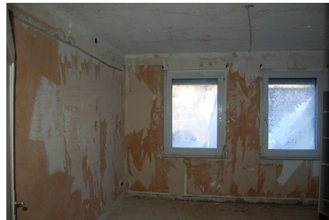
23 Zimmer Wohnung 2.JPG