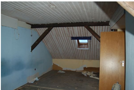
26 Zimmer DG.JPG