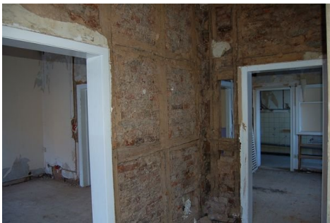
13 Flur Wohnung 1.JPG