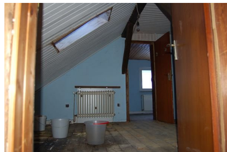
25 Zimmer DG.JPG