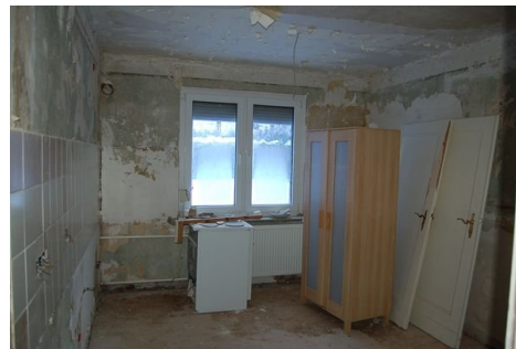
21 Zimmer Wohnung 2.JPG