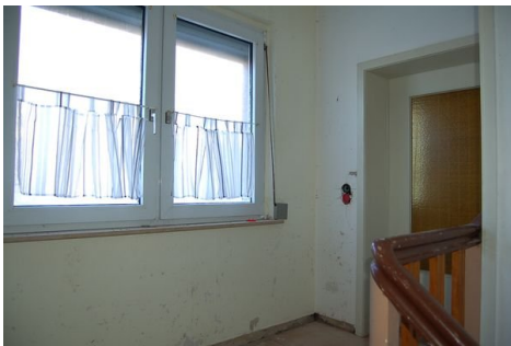
20 Flur Eingang Wohnung 2.JPG