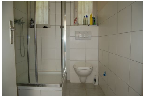
15 Bad 1 EG.JPG