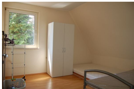
19 Schlafzimmer 3.JPG