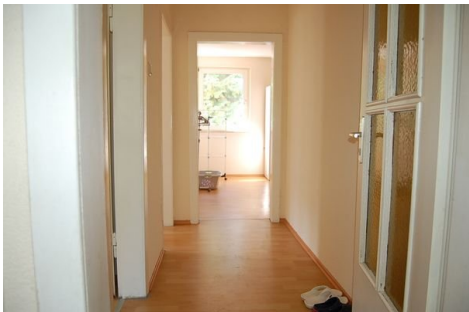
16 Flur DG.JPG