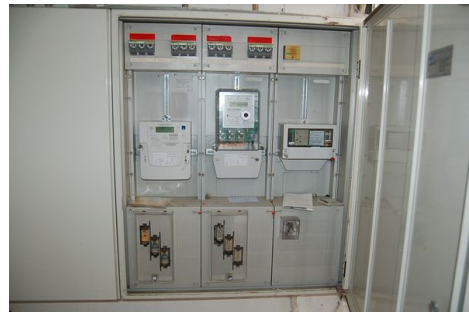
23 neue Elektrik.JPG