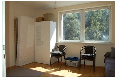
11 Zimmer EG.JPG