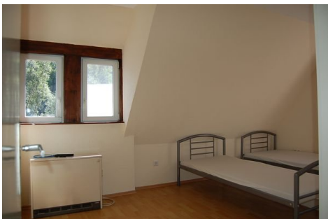
18 Schlafzimmer 2.JPG