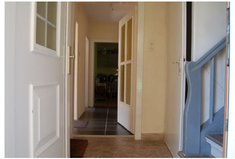
09 Flur EG.JPG