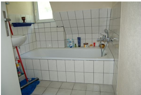
20 Bad 2 DG.JPG