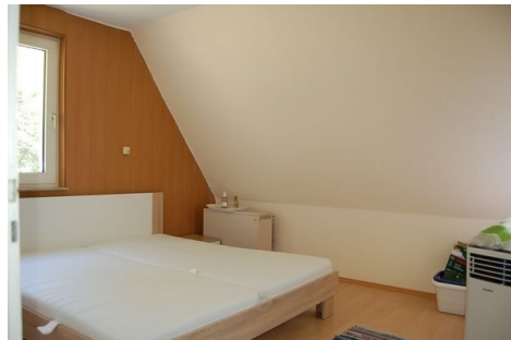
17 Schlafzimmer 1.JPG