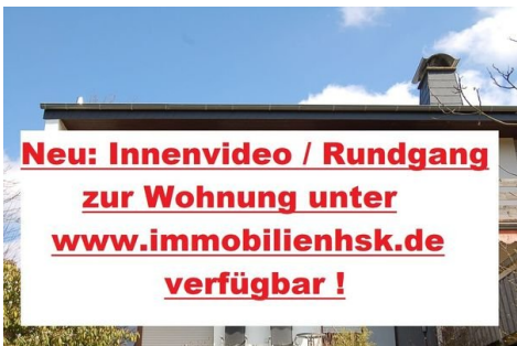
16 Hinweis Video.JPG