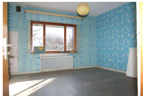
16 Zimmer EG.JPG