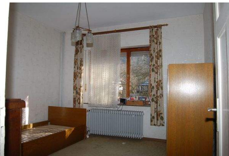
17 Zimmer EG.JPG