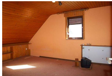
20 Zimmer DG.JPG